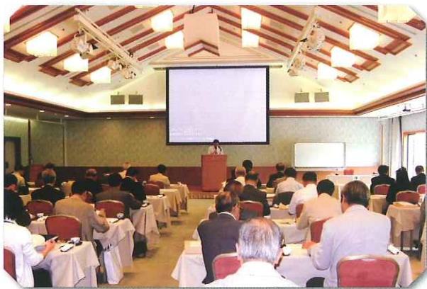
融資判断のポイントについて熱心に聴講される方々

最初に日本政策金融公庫の木村岐阜支店長から「公庫から見た融資判断のポイントと債権管理の現状」と題して、講演があり、衛経融資の現状と融資の実績、経営特別相談員における事業者への適切な指導・助言のポイントなど、また、公庫から見た融資判断のポイントなどについて詳しく説明があり、大いに参考になるとメモをとる等、熱心に受講されました。