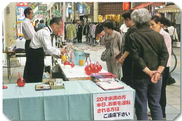
ピンククローバーを試飲する方々

当日は、岐阜バーテンダー協会の皆さんの協力のもと、来訪された方々に勢いよく提供しましたが、色もピンクで心地よく、アルコール度数も13%と低くて、特に女性の方々には飲みやすい、と大変好評でした。また併せて組合員のお店マップも配り、組合店のPRも行いました。多くの愛飲家の方々からは、嬉しい励ましの言葉をたくさん頂いたところです。