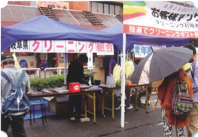
クリーニング組合イベントの様子

9月29日は、「クリーニングの日」です。これは、「ク(9)リーニ(2)ング(9)」の語呂合わせで、昭和57年に定められました。