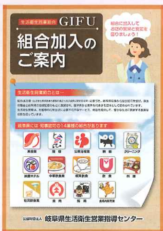
組合加入のご案内 (県センター作成)