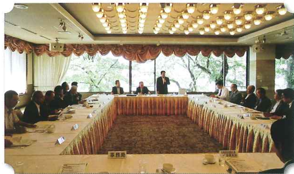
国会議員と各組合理事長との組織強化協議

最後に今後とも、関係機関が連携を密にして、生活衛生組合の基盤強化・組織強化を図っていくことを確認しました。