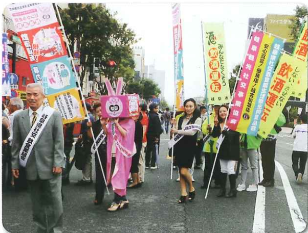
目抜き通りをパレードする組合関係者

組合では、10月の岐阜市「ぎふ信長まつり」において、組合オリジナルキャラクター「ピンクうさ交」も参加して、飲酒運転根絶、暴力団排除、無許可営業撲滅の啓発のぼりを掲げ、岐阜中警察署、岐阜市役所の協力を得て、役員・組合員が岐阜市の柳ヶ瀬本通りや歩行者天国を、ちらしを配りながら大パレードしました。