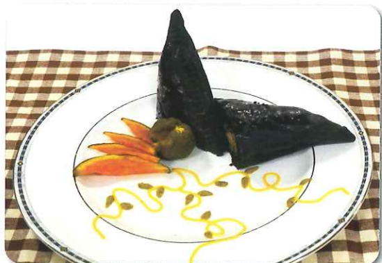
受賞作品 スイートパンプキンパイ