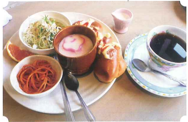
岐阜のモーニングサービス (一例)