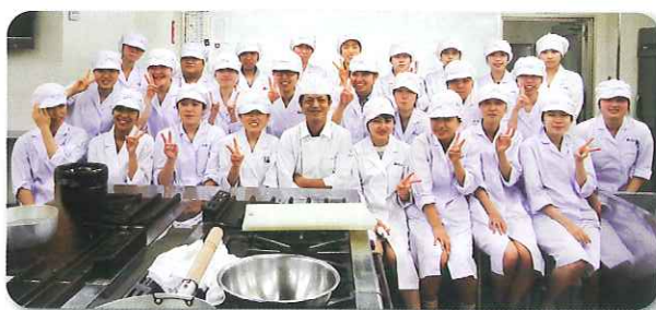
講師と参加された研修生の皆さん

これを機会として、今後多くの若者たちが生衛業に一層興味を持ち、そして、より多くの若者がこの業界に新たに参加するなど、生衛業界がより活性化し発展するよう期待するところです。