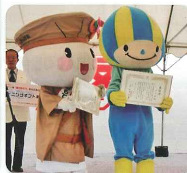
「ミナモ」と「おがっきい」に感謝状贈呈

また「今の衣替えの時期には洗ってから収納する「仕舞い洗い」を忘れず、汚れたらなるべく早くクリーニングすることが大事」とクリーニングの大切さを参加の方々に呼び掛けました。